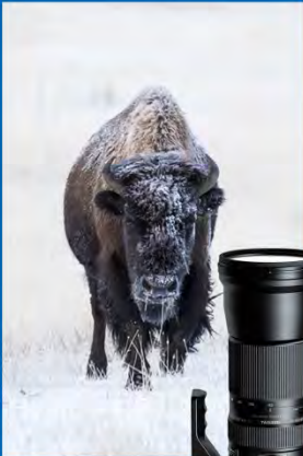
SP 150-600mm F/5-6.3 Di VC USD

Si compras tu objetivo TAMRON en este establecimiento, podrás obtener un reembolso de hasta 100,-€