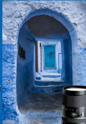
16-300mm F/3.5-6.3 Di II VC PZD