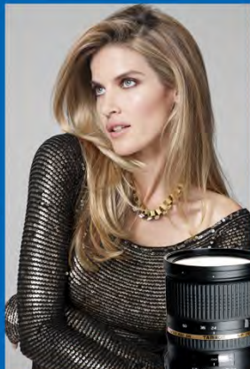
SP 24-70mm F/2.8 Di VC USD